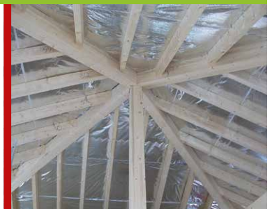
... UNTERSPEANNBahn IN EINEM