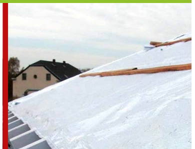
... DÄMMUNG UND...